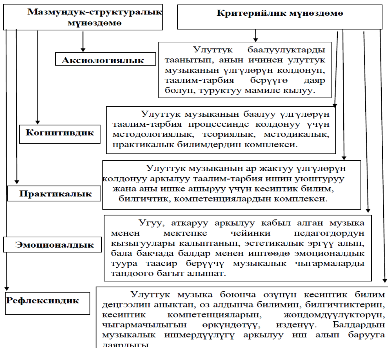
1-схема. Мектепке чейинки педагогдордун улуттук музыкага кызыгуусун калыптандыруучу мазмундук-структуралык жана критерийлик мүнөздөмөлөр.

Мектепке чейинки педагогдордун улуттук музыкага кызыгуусун калыптандыруунун мазмундук компоненттери, баалоого багытталган критерийлик мүнөздөмөлөрү модель түрүндө төмөндөгүчө жалпыланды: